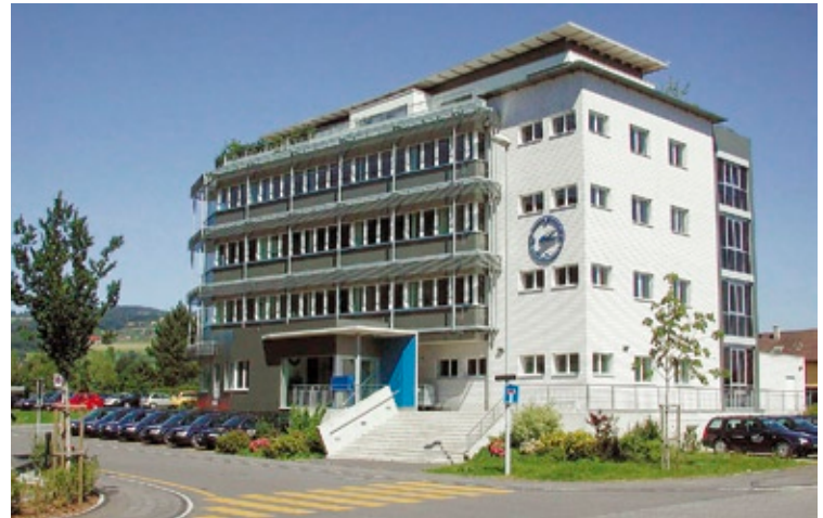
Glockenhof, Hauptsitz der ZEIT AG in Sursee

Das Wohn- und Pflegeheim Frienisberg verpflichtet sich für eine fachgerechte Pflege, Betreuung und Beschäftigung von Menschen, die nicht in der Lage sind oder es nicht mehr wünschen, ihr