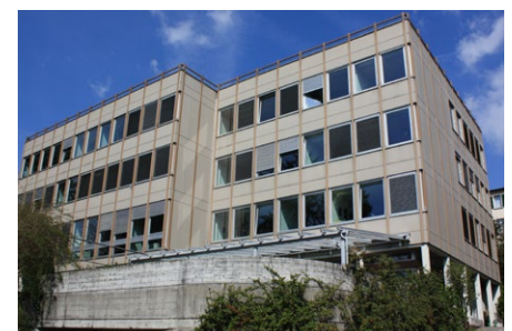
Hauptsitz der SNF, Wildhainweg, in Bern